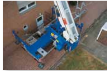
... KOMFORTABEL & SICHER!