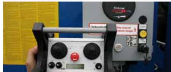
... INTELLIGENT & INNOVATIV!