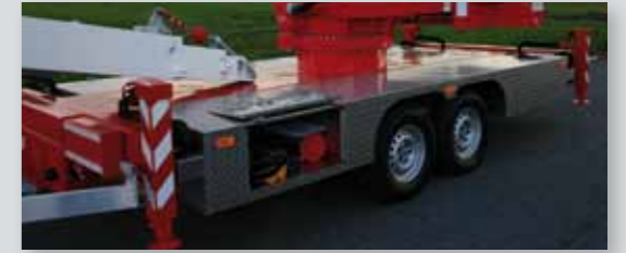
... SICHER & ATTRAKTIV