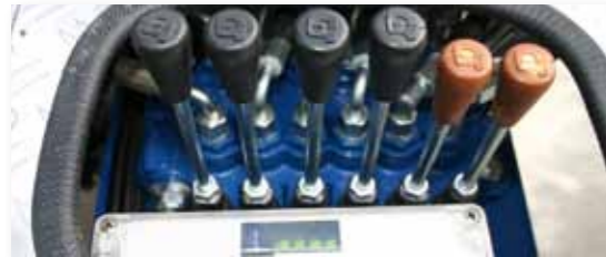
... LEISTUNGSSTARK & FLEXIBEL!