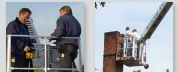
... CLEVER & FLEXIBEL!