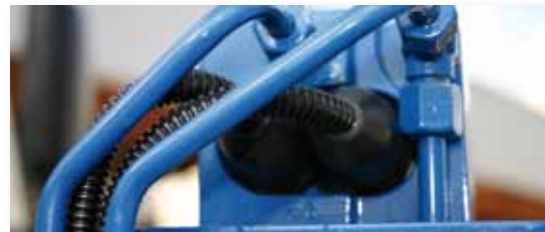
... SICHER & LEISTUNGSSTARK!