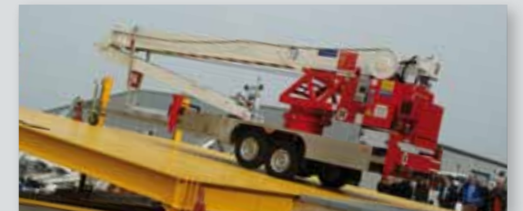
... CLEVER & FLEXIBEL!