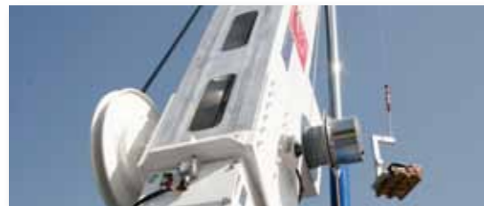
... LEICHT & LEISTUNGSSTARK!