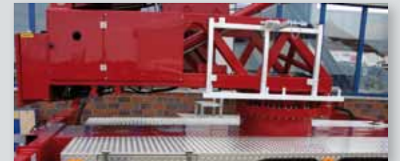
... PRAKTISCH & VARIABEL!