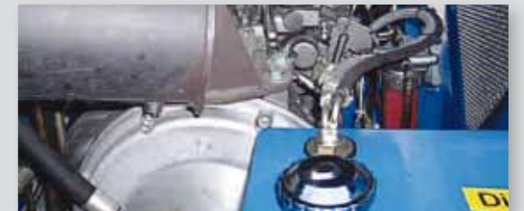
... SPARSAM & UMWELTFREUNDLICH!